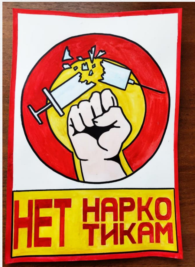
Гевля Софья (2 курс, оркестровые духовые и ударные инструменты)