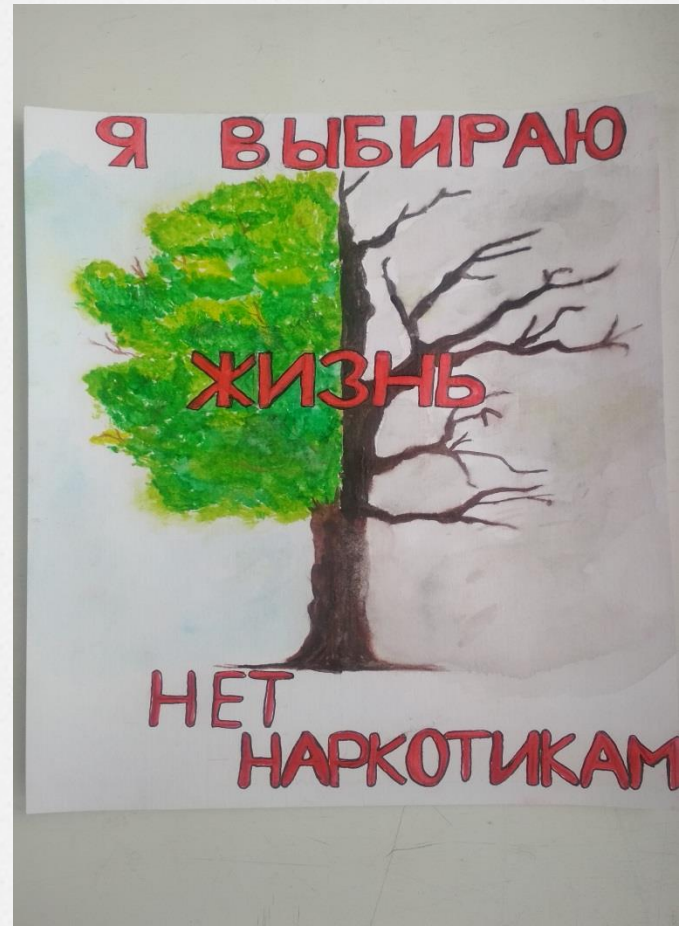
Цицвидзе Анна (1 курс, Оркестровые духовые и ударные инструменты)