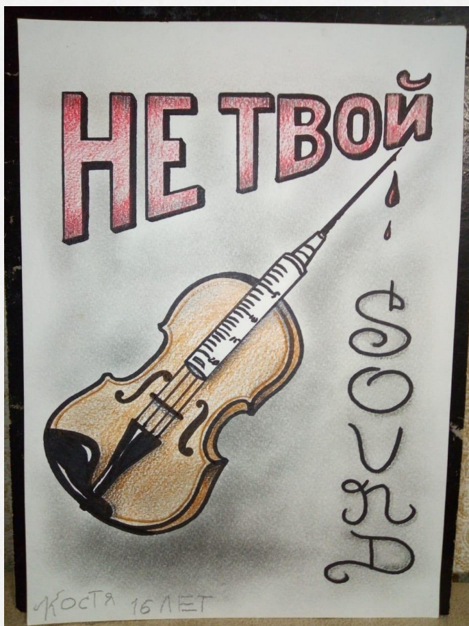
Боровиков Константин (1 курс Оркестровые струнные инструменты)

В нашей стране общая доля наркозависимых составляет около 5%. Эти цифры являются по-настоящему страшной статистикой, так как большинство среди наркоманов составляют молодые люди возрастом до 30-35 лет.