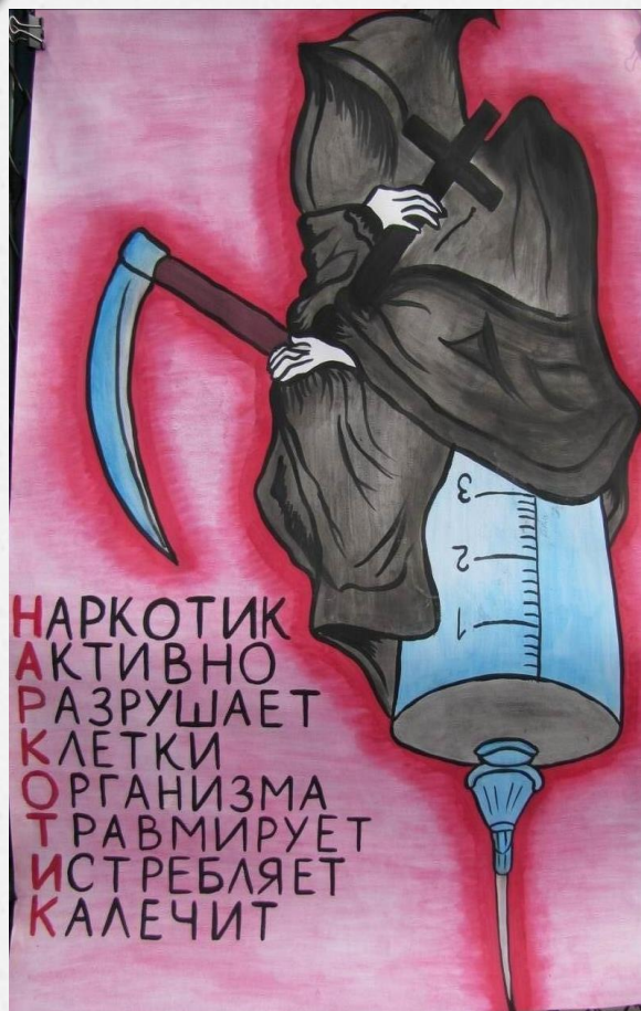
Плугова Виктория (4 курс, Теория музыки)

Наркомания — это настоящая беда современного общества. Она разрушает семьи, губит здоровье и просто убивает людей. Одних усилий государства по профилактике данной болезни недостаточно, поэтому мы все должны объединиться и оградить своих родных и близких от наркотиков