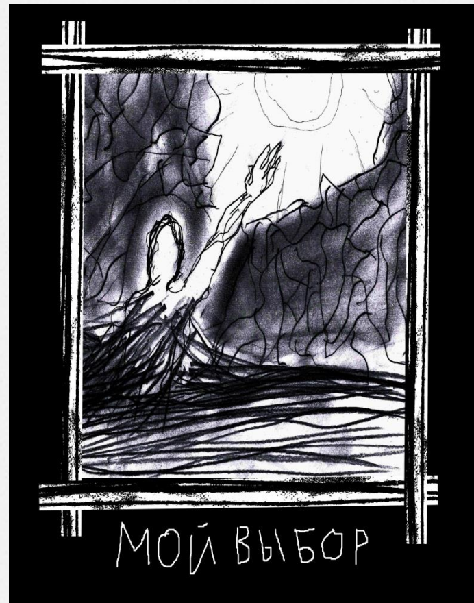
Ниссен Иван (3 курс, Актёрское мастерство)